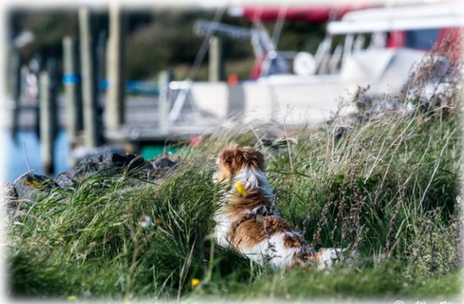
Der er noget