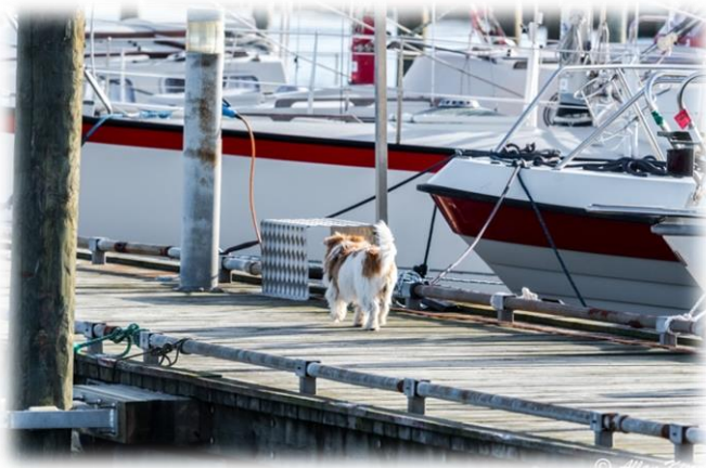
Afsted for at kikke