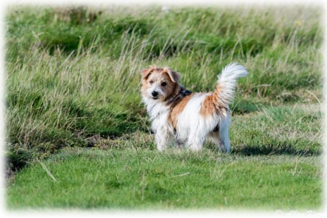
Det er der