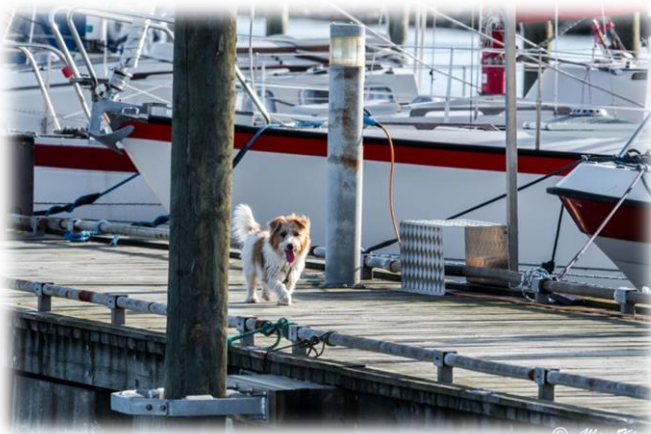
OK – jeg kommer