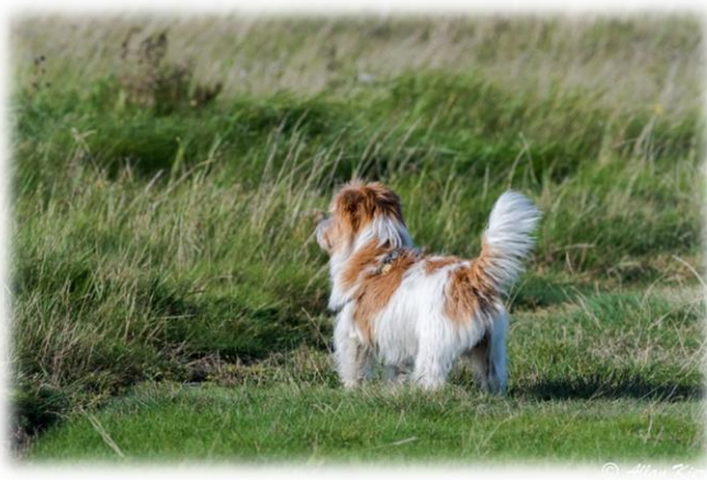
Der er vist noget her!