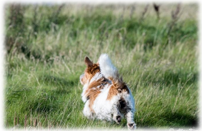
Afsted – det må tjekkes