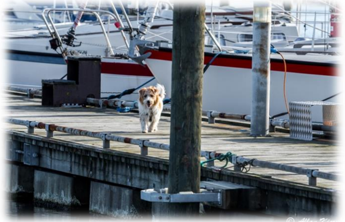
Hvad – SKAL jeg komme tilbage!