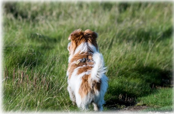
Det er der altså