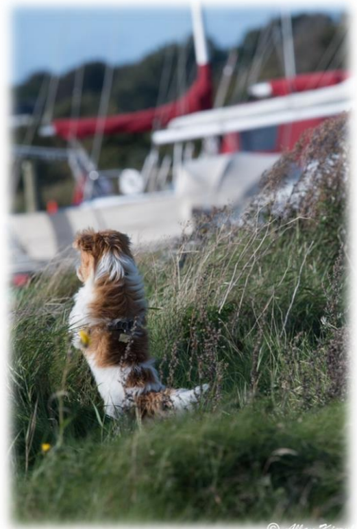
Sådanne noget har jeg ikke set før