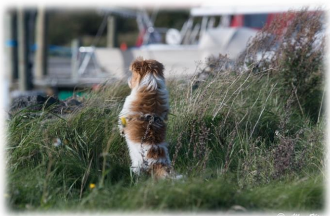
Men hvad er det ?