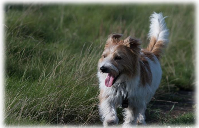
Afsted ud og strække ben.